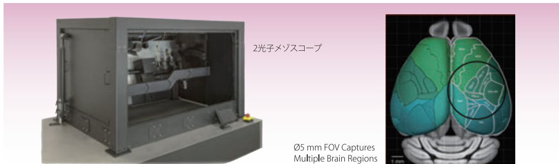
2光子メゾスコープ