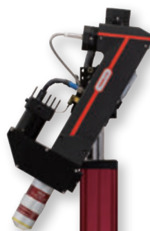
10倍の対物レンズ TL10X-2Pを搭載したPrelude™

2光子顕微鏡システムPrelude™は、機能イメージングに必要な柔軟性をさらに高め、難しい位置決め要件の試料にも対応します。電動のXYZ移動と手動の±90°回転で、試料に対して非垂直の多軸アクセスが可能です。複雑なアライメントを必要としないファイバ結合型の設計により、操作性を追及しています。