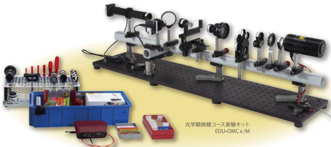
光学顕微鏡コース実験キット EDU-OMCx/M