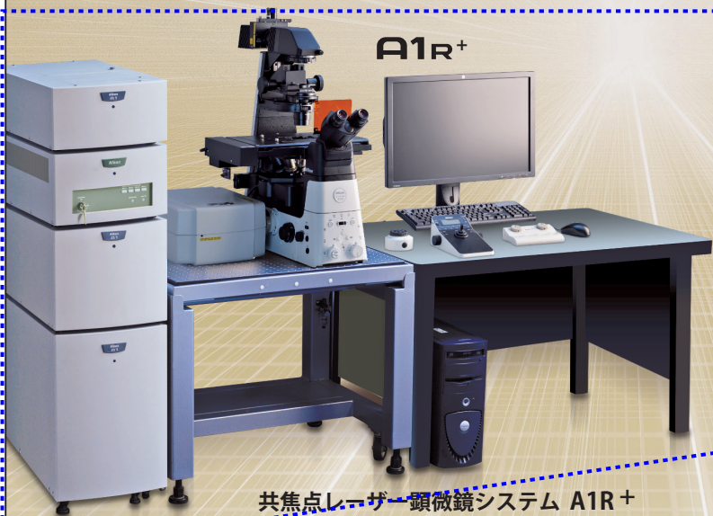
共焦点レーザー顕微鏡システム A1R+

常に頂点を目指して挑戦し続けるニコンの高度な顕微鏡技術が、生命科学の明日を揺り動かします。