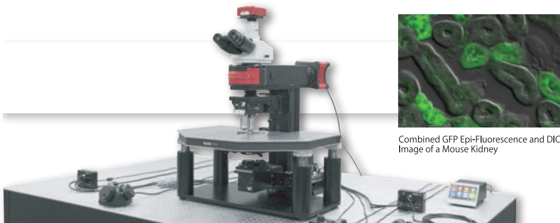
Combined GFP Epi-Fluorescence and DIC Image of a Mouse Kidney

Cernaシリーズは、明視野、微分干渉、Dodtコントラスト、蛍光、レーザ走査などさまざまな検鏡法をサポートする汎用顕微鏡プラットフォームです。モジュール式设计を採用しているため、あらゆる実験上の個別ニーズへのカスタム対応を可能にします。