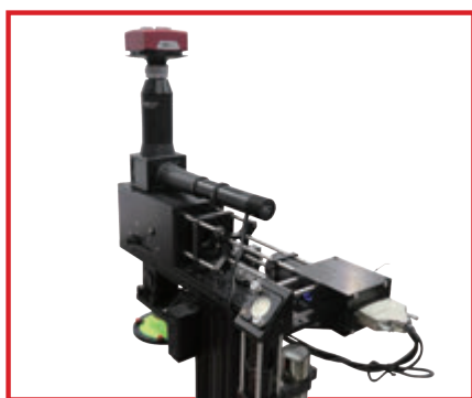
ガルバノ-ガルバノスキャナLSK-GGを使用したレーザ走査型システムの構成例