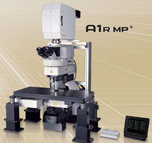
高速多光子共焦点レーザー顕微鏡システム A1R MP+