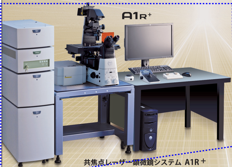
共焦点レーザー顕微鏡システム A1R+

常に頂点を目指して挑戦し続けるニコンの高度な顕微鏡技術が、生命科学の明日を揺り動かします。