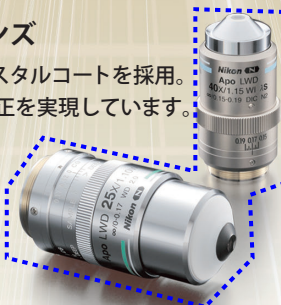
Lambda S 対物レンズ