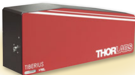
フェムト秒レーザー光源Tiberius (オプション)