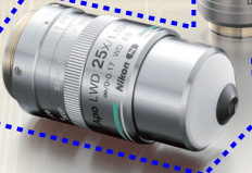
Lambda S 対物レンズ